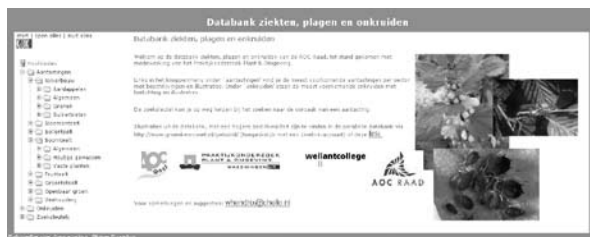
Screenshot van de beeldenbank.