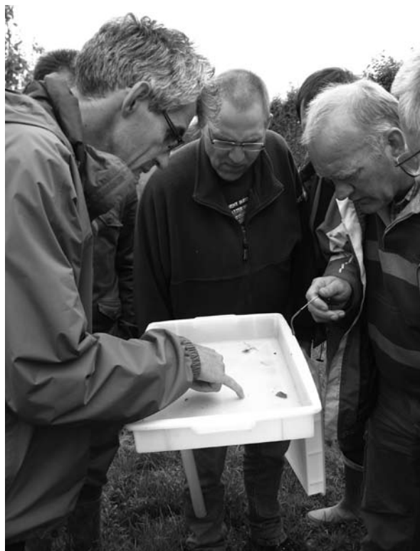
Mbo-docenten waarderen de inbreng van onderzoekers tijdens scholingsactiviteiten zoals in Randwijk op 8 oktober 2008. De kwaliteit gaat omhoog.

Onderzoekers spelen een actieve rol in de ondersteuning van docenten bij scholingsactiviteiten. Dit is een manier om de actuele kennis toegankelijker te maken voor het onderwijs. “Die ondersteuning is echt nodig,” vindt Van Splunter. “Je kunt er ook zelf mee aan de slag door de documenten en presentaties van de lespakketten te downloaden van groenkennisnet, maar het valt je toch rauw op je dak. Het is moeilijk er een goed verhaal bij vertellen.” Hij is in het cursorisch onderwijs nu bezig met het lespakket ‘natuurlijke vijanden’. “Plezierig dat een onderzoeker me helpt bij het onderdeel insectenherkenning,” zo vertelt hij. “Ik mis die kennis zelf. Het onderwijs komt zo op een hoger plan.” Schouwenaar vindt de verdieping vooral belang-