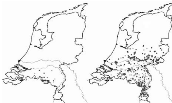
Figure 1: Oak processionary caterpillar (OPC) distribution maps of the periods 1991/1993 and 2006/2007 in The Netherlands. The darker dots represent the more recent years. Since the OPC's first appearance in 1991 its distribution area has moved in north-eastern direction, expanded rapidly as well.

the OPC with weather data that were based on data from thirty to forty MétéoConsult weather stations, comparing the region where the OPC occurred to regions without OPC observations. The large number of weather stations gave us a unique insight in regional climate differences. By combining the found relation between climate and occurrence with the four climate change scenarios of the KNMI, we assessed the potential future distribution of the OPC.