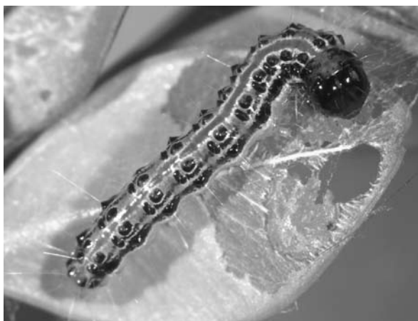
Foto: Buxusmot

In 2007 hebben amateur-entomologen in Weil am Rhein in de Duitse deelstaat Baden-Württemberg onbekende rupsen gevonden die flinke schade aan buxusplanten hebben veroorzaakt. Het bleek voor Europa een nieuw soort te zijn: Glyphodes perspectalis (Walker) (syn. Diaphania perspectalis ). Deze mot is afkomstig uit Azië en was tot aan de vondst in Duitsland alleen bekend uit Japan, Korea en China. Mogelijk is deze mot via import van Buxus uit deze landen in Duitsland geïntroduceerd en vermoedelijk al sinds 2005 of nog eerder in Baden-Württemberg aanwezig. Pas in 2007 en vooral in 2008 is op grote schaal schade vastgesteld. De rupsen zijn ook gevonden ten oosten van Mönchengladbach (deelstaat Noord-Rijn-Westfalen) en bij Basel in Zwitserland (dicht bij Weil am Rhein). Van nature vliegt de buxusmot niet over grote afstanden en lijkt de plaag (nog) vrij lokaal voor te komen. De plantenziektkundige diensten in de verschillende Duitse deelstaten onderzoeken momenteel in hoeverre de plaag is verspreid in Duitsland en of de soort kan worden uitgeroeid.