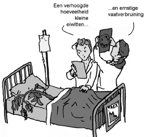
Figuur 2. In een zieke tomatenplant worden kleine eiwitten in de xyleem- of houtvaten uitgescheiden, zowel door de schimmel als door de plant. Ook kleuren de vaten bruin. Dit is een gevolg van de ophoping van fenolische stoffen die door de plant worden gemaakt om de schimmel te hinderen.

te verstevigen, het ophopen of uitscheiden van giftige stoffen en het inkapselen van de aanvallers. Net als bij ridders zijn ook voor schimmels de meest effectieve strategieën het gebruik van list, bedrog en manipulaties, bijvoorbeeld door zichzelf onzichtbaar te maken, het op gang komen van de afweermechanismen te frustreren, de voorraden van het slachtoffer voor eigen gewin aan te wenden en zo snel mogelijk alle cruciale onderdelen in handen te krijgen.