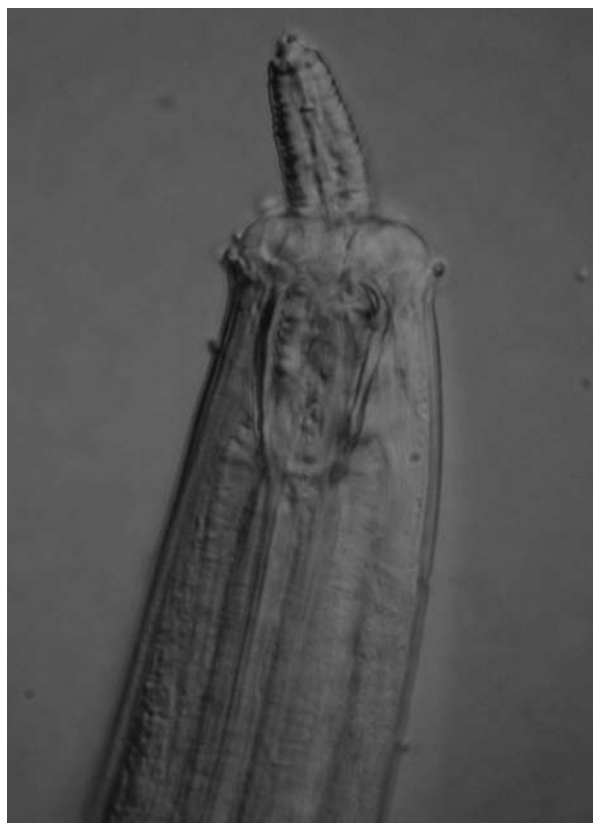
Foto: De kop van een carnivore nematode die een plantenetende nematode naar binnen heeft geslurpt. De carnivore nematode heeft een grote stevige tonvormige mondholte met rechtsboven een tand. De plantenetende nematode heeft een holle stekel, die als rietje werkt, met aan de basis een paar stekelknoppen. De planteneter gebruikt de stekel om cellen in plantenwortels aan te prikken en leeg te zuigen. Aan de stekelknoppen zijn spieren bevestigd die het mogelijk maken de stekel in de plantencel te prikken.

"Zware metalen binden zich in de bodem aan kleideeltjes en organisch materiaal", zegt De Goede. "Die gebonden metalen leveren minder risico op omdat organismen ze niet meer goed kunnen opnemen. Er zijn rekenmethoden die je vertellen hoeveel zware metalen in een bodem beschikbaar zijn, en volgens die methoden zou er in de Waalse uiterwaarden een aanzienlijke toxicologische stress zijn. Maar toen we de genera van de aaltjes in de bodem bepaalden, vonden we geen aanwijzingen voor toxicologische stress.