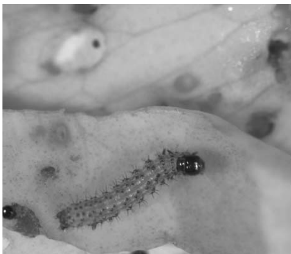
Foto: Jonge rups van Helicoverpa armigera op roos uit Kenia

De Keuringsdiensten en de PD registreren alle vondsten van quarantaine-organismen in planten en plantaardige producten in Nederland en in Nederlandse producten in het buitenland. In het zojuist verschenen rapport Fytosanitaire signalering 2007 laat de PD zien wat deze fytosanitaire inspecties in 2007 hebben opgeleverd. De PD signaleert trends en nieuwe risico's op het gebied van plantgezondheid. Daarnaast bevat het rapport de actuele pest-status van quarantaine-organismen, die beschrijft of het organisme aanwezig is in Nederland. Dit is de basis voor de fytosanitaire garanties die Nederland verstrekt bij de export van planten en plantaardige producten. Het rapport is het vierde deel in de reeks van jaarlijkse Fytosanitaire signaleringen die in 2004 is gestart.