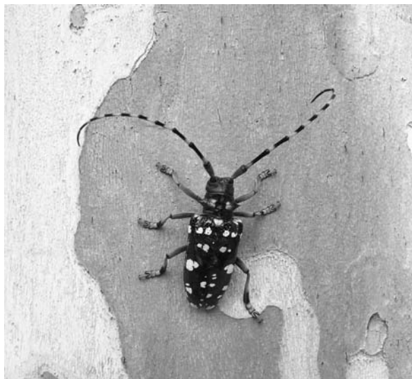
Vrouwelijke boktor ( A. chinensis ); copyright Matteo Maspero

Deze zomer is de Aziatische boktor op twee plaatsen in Nederland gevonden: in Enschede en in Berghem (gemeente Oss). Deze boktor, met de Latijnse naam Anoplophora glabripennis , komt van oorsprong voor in Oost-Azië. De kever is zeer schadelijk voor bomen en struiken en is daarom in de EU een quarantaine-organisme. De boktor is niet gevaarlijk voor mensen. Nederland is verplicht deze boktor te bestrijden.