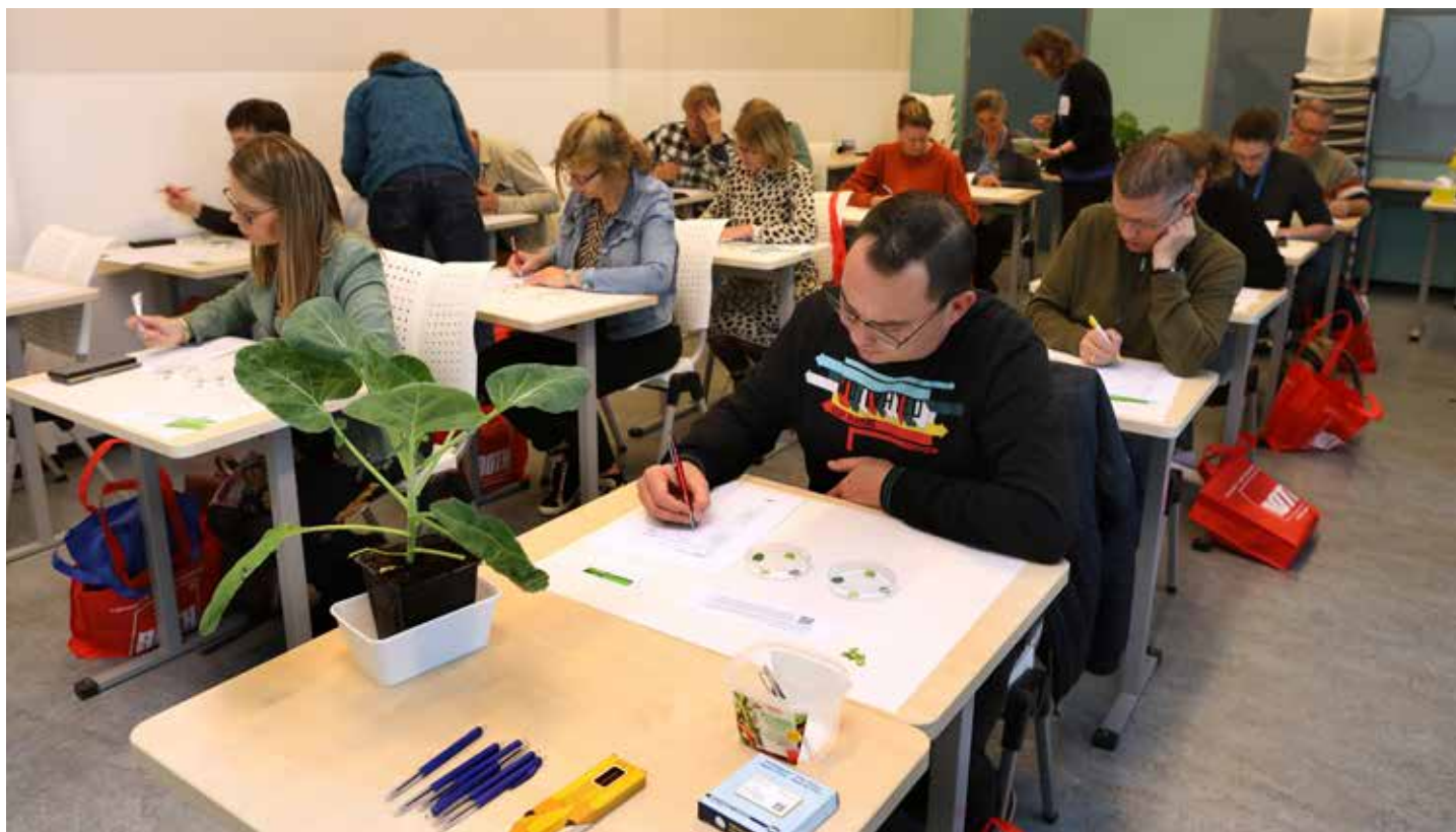
Deelnemers aan de NVON-dag doen het rupsenpracticum tijdens de workshop 'Plantenziekten Proefjes' van de Scholierenwebsite.

van twee koolsoorten: Brassica oleracea en Brassica rapa . Deze soorten zijn door mensen gekruist naar allerlei verschillende vormen (bijv. knollen of kroppen) d.m.v. convergente domesticatie. In de les bekijken de leerlingen een aantal koolgewassen, zoals spitskool, broccoli, bloemkool, koolrabi en spruitjes, die gemakkelijk verkrijgbaar zijn in de winkel. De groenten worden in de lengte doorgesneden en de leerlingen bedenken wat het eetbare deel van iedere soort is en waarop de oorspronkelijke plant veredeld kan zijn. Het is een goede manier om leerlingen enthousiast en nieuwsgierig te maken over de veelzijdigheid van planten.