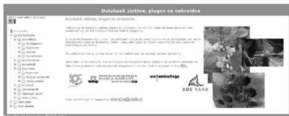
Screenshot van de beeldenbank.

wijs. Contactpersoon is Barry Looman (e-mail: b.looman@wellant.nl tel. 030 - 63 45 290 mobiel: 06 51 77 07 43). Of kijk op www.groenkenniscooperatie.nl . Een direct adres naar het programmateam is https://livelink.groenkennisnet.nl/gkc/gewasbescherming .