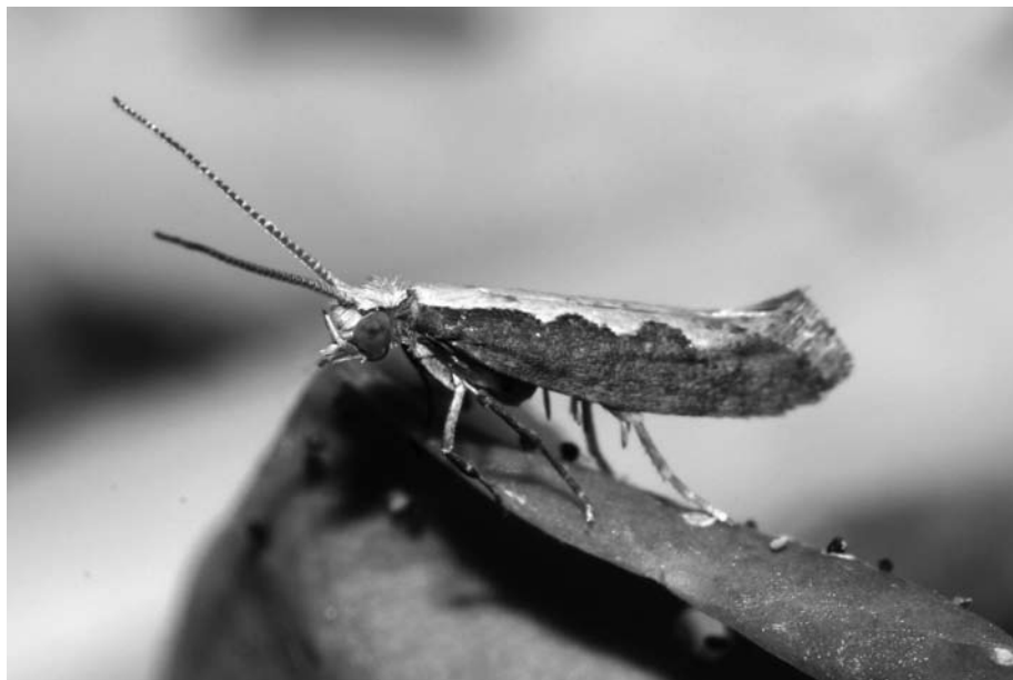
Figuur 4. Koolmot.

de kwalitatieve samenstelling van de geurstofemissie belangrijker is dan de kwantiteit voor de aantrekking van sluipwespen.