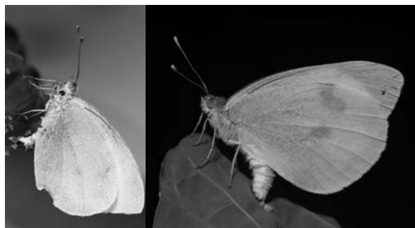
Figuur 3. Het kleine koolwitje legt enkele eitjes op een koolblad (links), terwijl het grote koolwitje een heel eipakket legt (rechts).

dediging tegen vraat door plantenetters. Het aanbrengen van dit plantenhormoon op een plant kan inductie van een verdedigingsmechanisme tot gevolg hebben. Deze reactie van de plant lijkt op (maar is niet identiek aan) de chemische verandering als reactie op beschadiging door plantenetters. De behandeling van spruitkoolplanten met dit hormoon beïnvloedde het gedrag van plantenetters. Twee specia-