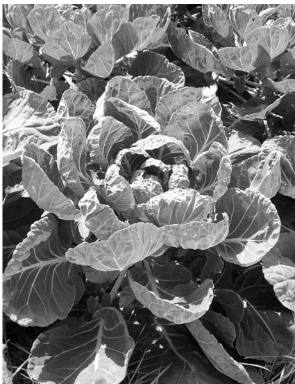
Figuur 1. Spruitkoolplant in het veld.