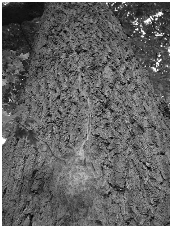
Nest van de eikenprocessierups in Wageningen; bron: www.plantenziektkunde.nl .

zijn, een waarde die gewoon is in het leefgebied van de eikenprocessierups. Op basis van de klimaatscenario's acht Van Oudenhoven het dus zeer waarschijnlijk dat de eikenprocessierups over tien jaar in het hele land zal voorkomen. Gemeenten in het noorden van het land dienen de komende jaren dan ook alert te zijn op de komst van rups, meldt De Natuurkalender.