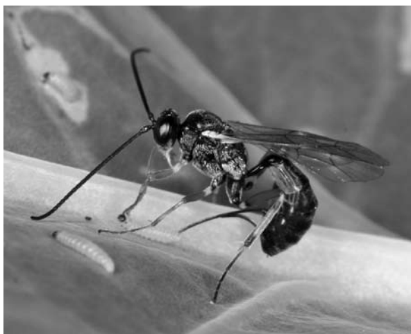
Figuur 2. Een sluipwespvrouwtje legt haar eitjes in een rups.

dediging tegen vraat door plantenetters. Het aanbrengen van dit plantenhormoon op een plant kan inductie van een verdedigingsmechanisme tot gevolg hebben. Deze reactie van de plant lijkt op (maar is niet identiek aan) de chemische verandering als reactie op beschadiging door plantenetters. De behandeling van spruitkoolplanten met dit hormoon beïnvloedde het gedrag van plantenetters. Twee specia-