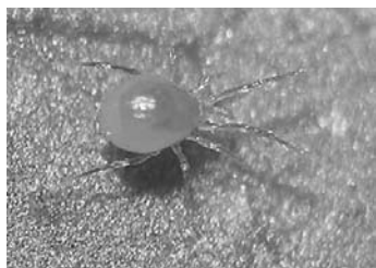
Een gezonde roofmijt.

Twee tot vijf dagen na besmetting is zo'n tachtig procent van de roofmijten gekrompen. De besmetting is overdraagbaar via mijtenpoep. Dicke: 'Hun darmkanaal kan echt bomvol zitten met de bacterie, waardoor vitale functies uitvallen.'