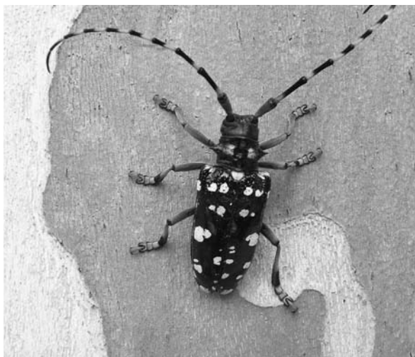
Vrouwelijke boktor ( A. chinensis ); copyright Matteo Maspero.

Eind november 2007 zijn bij een importeur in het Westland met Anoplophora chinensis besmette esdoorns aangetroffen. Daarop is rond het bedrijf gezocht naar besmettingen met deze boktor in esdoorn en andere waardplanten. Er zijn twee besmette planten gevonden, waarvan één die was besmet met achttien larven. Daarnaast zijn nog vijf besmette planten gevonden, allen dichtbij de eerder gevonden besmettingen. De activiteiten in het Westland zijn vergezeld gegaan van een intensieve communicatie met de gemeente en de bewoners. De actie is in goede samenwerking verlopen. De komende jaren zal de situatie in het gebied worden gevolgd. In vervolg op de vondst in het Westland zijn im-