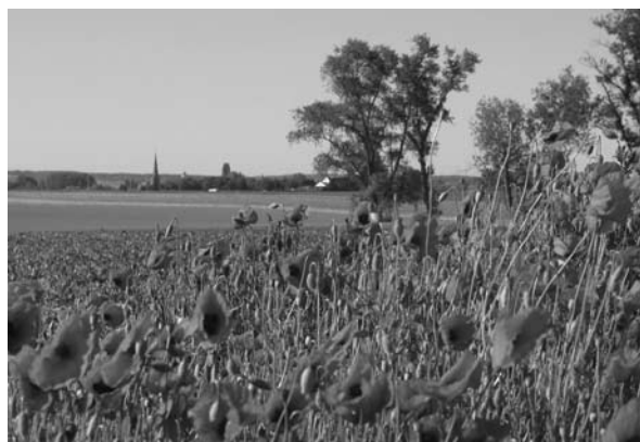
Bloemen fungeren als tankstation.

Bianchi onderzocht met behulp van een simulatiemodel hoe verschillende typen bloemen de biologische bestrijding door sluipwespen in de akker beïnvloeden. 'We moeten ons realiseren dat het veel uitmaakt welke bloemen er gebruikt worden.' Hij laat met zijn simulatie zien dat de