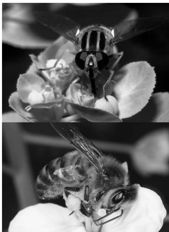
Figuur 5. Zweefvlieg (boven) en honingbij (onder).

phenidone verminderde deze voorkeur. Deze resultaten geven aan dat de eilegvoorkeur van deze specialistische planteneters een chemische basis heeft en het remmen van de octadecanoid reactieketen hun gedrag beïnvloedt.