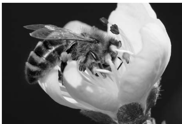
Bij op perzikbloesem.

De oplossing moet gezocht worden in niets minder dan een ‘Deltaplan’. Ons land trekt jaarlijks 150.000 euro uit voor onderzoek naar de bij en de Europese Commissie doet daar eenzelfde bedrag bij. Dommerholt pleitte ervoor om in navolging van onze buurlanden, België en Duitsland, één miljoen euro uit te trekken. Dat geld zou moeten gaan naar onderzoek, het opleiden van circa vijfhonderd imkers per jaar en voorlichting. Dat neemt niet weg, dat voor de bij de plant belangrijker is dan de mens. Agrariërs, gemeentelijke plantsoenendiensten, Staatsbosbeheer, Rijkswaterstaat en provincies moeten heel nadrukkelijk letten op het assortiment van planten dat wordt bestoven door insecten. Dat is niet alleen goed voor de honingbijen, maar ook voor vlinders, hommels en sluipwespen. In de