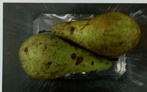
Phialophora - visogen