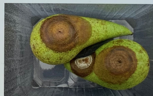
Neofabraea - Gloeosporium